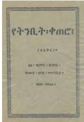
እዚን ካልእ ብዙሕ ብድሆታት ሰጊሮም ግን ታሪኽ ፍጹም ዘይርስዎ ኣበርክቶ ገይሮም ሓሊፎም ኢዮም። እስከ ንሎሚ ካብቲ ዝጸሓፉዎ መጽሓፍቲ ንገሊኡ ናባኹም ከበሎ እም ኣብ ዝቕጽል ድማ ንገሊኡ ናባኹም ከብሎ ኢዮ።

ክሕጽሮ እምበር ኣብ ጊዜ ሚካኤል ዝጀመረ ወፍሪ ጽልእን ምንጻልን ንመንነትና ታሪኽን ክሕከክ ሒሊት ምባል ብዙሕ ኣብነታት እኳ ተሃለዎ ንሎሚ ዛዕባና ጉዳይ ከበደ ሚካኤል ብምኳኑ ኣብዮ ክግድብ ይቕሰብ ምህላወይ ክሕብር እፈቱ። ኣብዛ ቀዳመይቲ ክፋል ዝኹነት ጽሑፊይ ቕድሚ ምዝዛመይ-ኣቶ ከበደ ሚካኤል ብዛዕባ ታሪኽ ኣድሂቦም ዝጸሓፉዎ መጽሓፍቲ ቤቶም ምስ ተቃጻለ ዝሓደሮም ጓሂ ክሳዕ ሕማም ኣብጊሖም ኢዮ። ካልኣይ ወላዲ ኣቡኣም ብዕሊ ዘይፈልጡን ብስም ኣኩኣም ምጽውዖም ከቢድ ሕልናዊ ሕቶታት ነይርዎም ኢዮ።