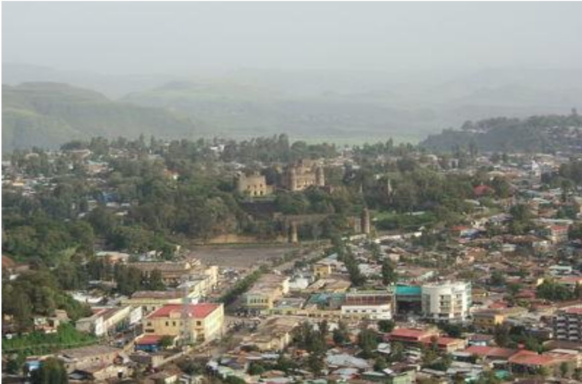
የጎንደር ከተማ ከፊል ገዕታ

የፀጥታው ጉዳይም ምንም የሚያሳስብ ነገር እንደሌለ፤ ፍፁም ሰላማዊ መሆኑና ባለፈው ተከሰቶ የነበረው ግርግርና ሁከት ሁሉ መክሰሙን የበአሉ አዘጋጅና ተባባሪዎች መግለፃቸውም የበአሉን ድምቀትና ሰላማዊ ሁኔታ ከወዲሁ የሚያመላክት ነው።